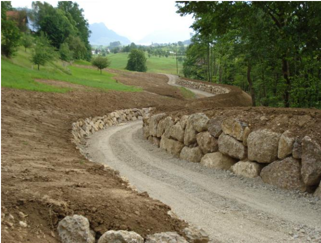
Umsetzung: Stein- und Blockschlag Schutzdamm in 6404 Greppen um die unterhalb liegenden Gebiete zu schützen.