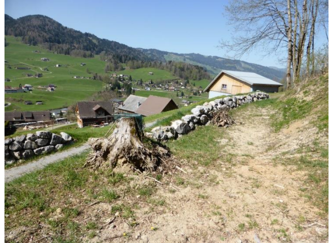
Der Damm wurde in zwei sich überlappenden Teilen gebaut aufgrund der Geländegegebenheiten.