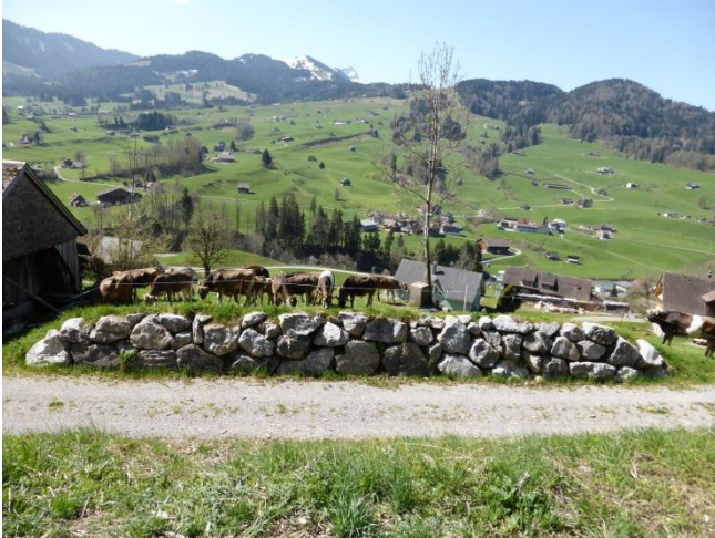
Umsetzung: Schutzdamm gegen Steinschlag im Gebiet Egg bei 9643 Krummenau.