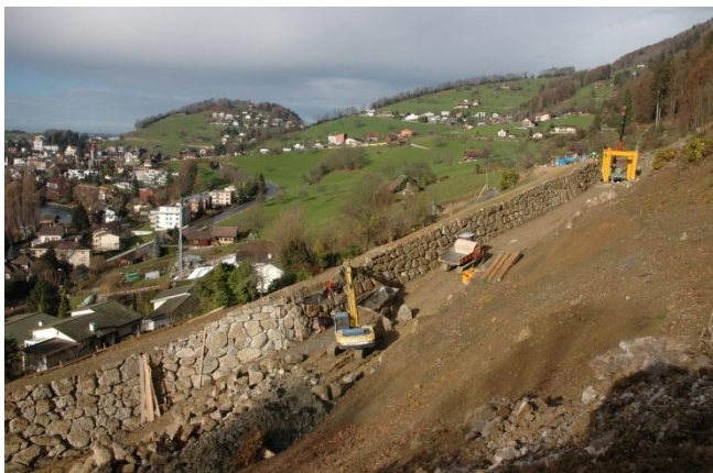
Umsetzung: Bau des Schutzdammes Laugneri I in Weggis