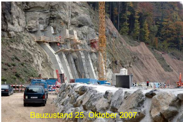
Bauzustand 25. Oktober 2007