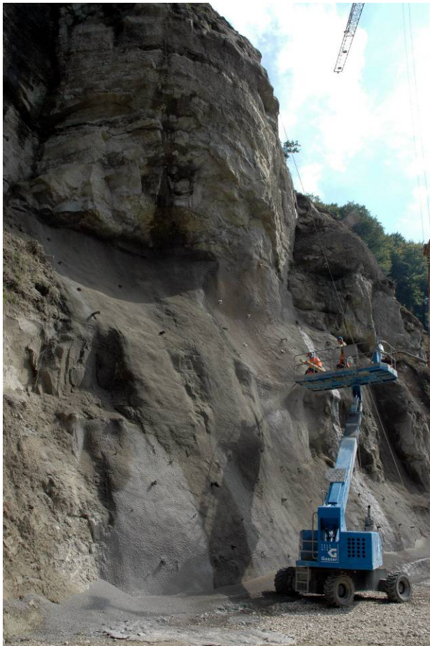
Bauzustand am 7. September 2007