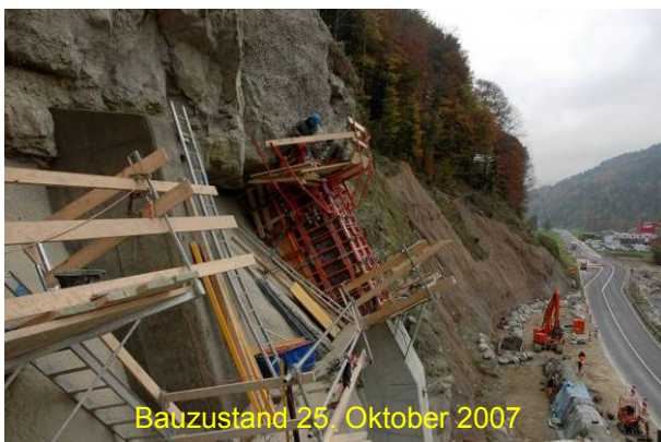
Bauzustand 25. Oktober 2007