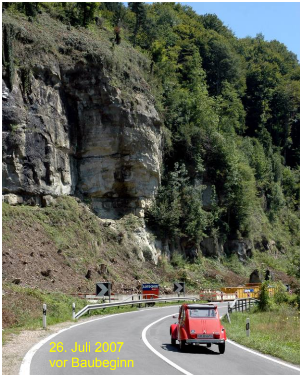
26. Juli 2007 vor Baubeginn