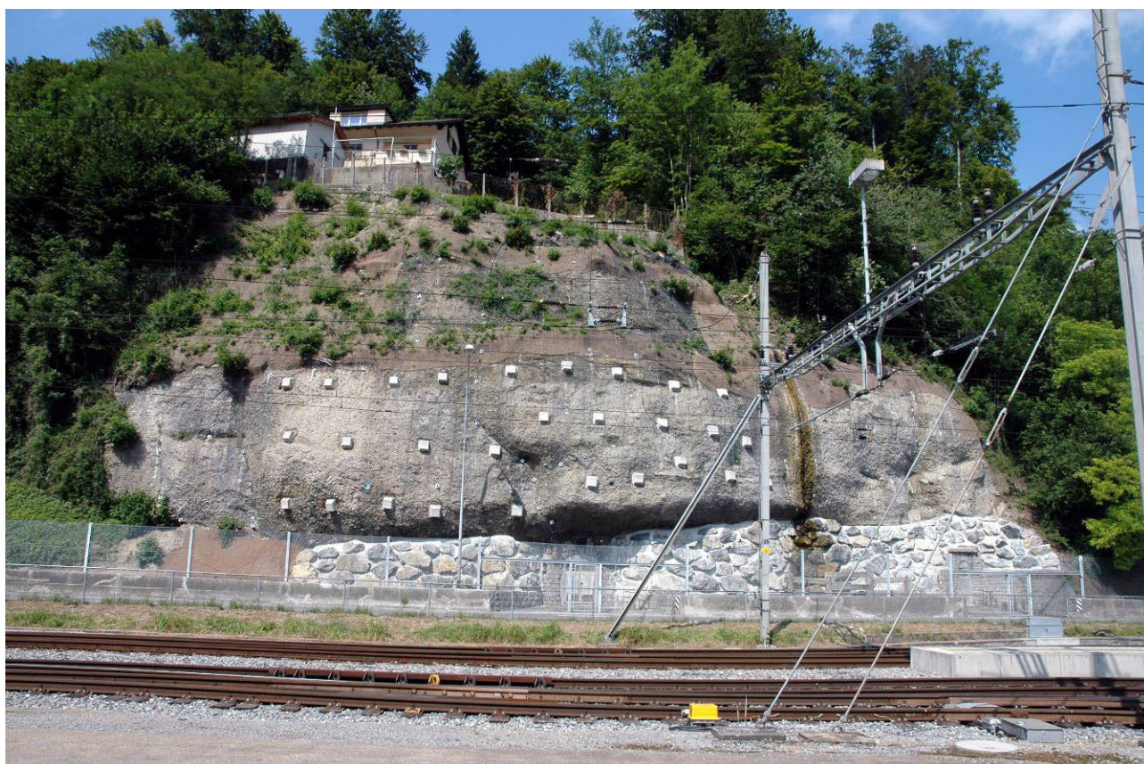
Zustand nach Abschluss der Arbeiten am 23. Juni 2007