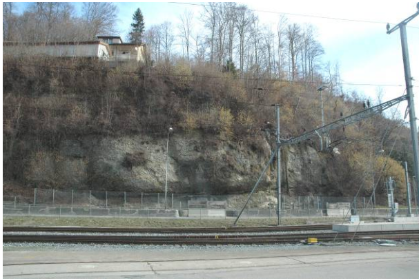
Zustand vor Massnahmen