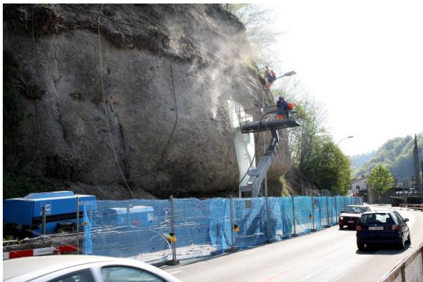
Während der Ausführung, Ende April 2007