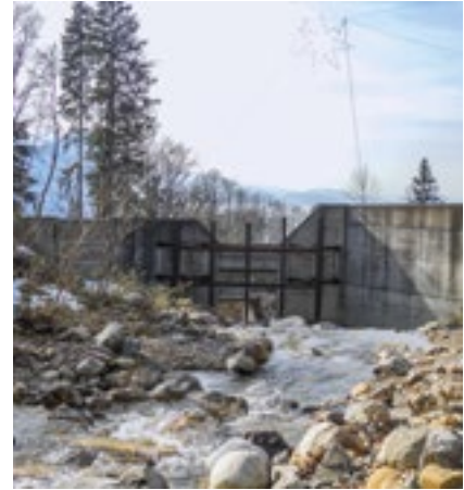
Geschiebesammler im Einzugsgebiet des Altdorfbachs in Vitznau. Seine Kapazität vermag lediglich das Material eines Murgangereignisses mit Wiederkehrdauer von 30 Jahren aufzunehmen.

haben. Unzählige spontane Wasseraustritte führten auch im Wald zu Rutschungen. «Wir schenken den Rutschprozessen heute viel mehr Aufmerksamkeit als früher», sagt Silvio Covi, der als Schutzwaldbeauftragter des Kantons die Luzerner Rigigemeinden seit 28 Jahren betreut. Die Begehungen nach dem Unwetter hätten gezeigt, dass die Bäume im grossflächig wirksamen Schutzwald riesige Mengen an Erdmaterial, Steinblöcken und Holz effizient aufzuhalten vermochten.