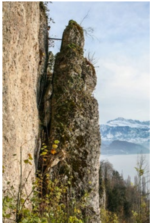
Die Bewegung des Felsturms H16 wurde mittels Telejointmeter im Rohr überwacht.