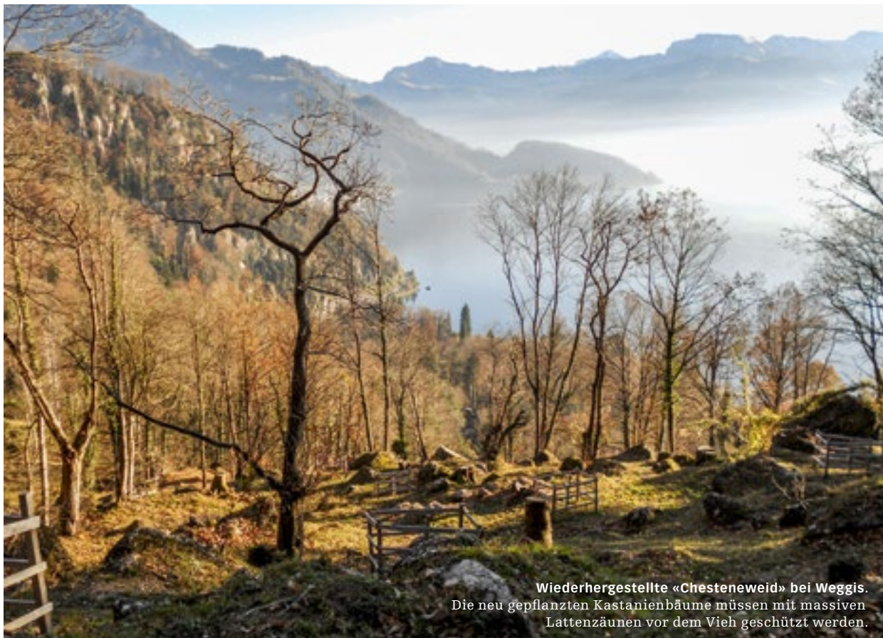
Wiederhergestellte «Chesteneweid» bei Weggis. Die neu gepflanzten Kastanienbäume müssen mit massiven Lattenzäunen vor dem Vieh geschützt werden.