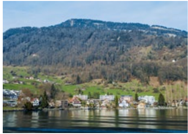
Der Chilenwald schützt Weggis.

Die Struktur der Schutzwälder der Luzerner Rigigemeinden ist dank der langjährigen Schutzwaldpflege gut. Mit gezielten Verjüngungsschlägen wird sie weiter verbessert. Die Bewirtschaftung der Wälder an